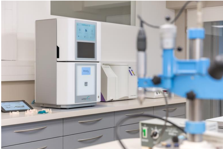
3D-Drucker im Dentallabor: Die Rainer Ulbricht Dental-Technik GmbH nutzt die Additive Fertigung bereits und beteiligt sich am Forschungsprojekt SAViour.