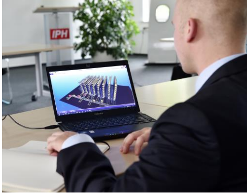
Digitales Know-how: Die Schulungsteilnehmer erfahren unter anderem, wie sich Fabriken am Computer simulieren lassen.