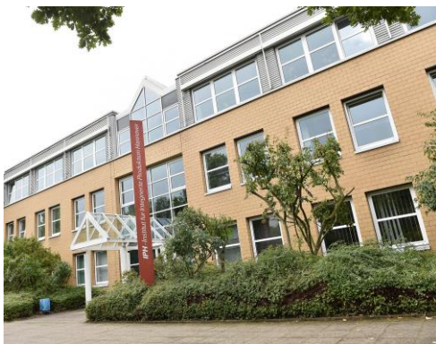
Führend im Bereich Industrie 4.0: Das Institut für Integrierte Produktion Hannover (IPH) im Wissenschaftspark Marienwerder.